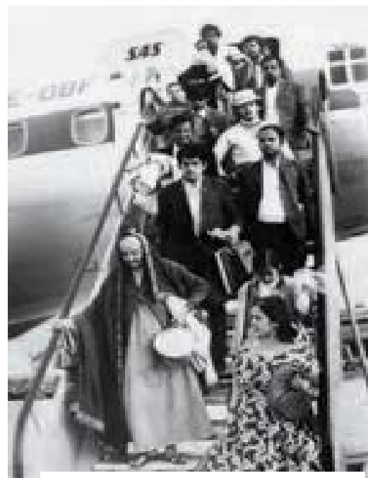
Cientos de miles de asiáticos fueron expulsados de Uganda de manera arbitraria en la década de 1970 y se convirtieron en verdaderos apátridas.

A los Estados se les está exhortando para que se adhieran a las dos Convenciones sobre apatridia. Un logro particular fue el estudio que realizó el ACNUR en 191 países en el año 2003. Los resultados de este estudio han contribuido a crear por primera vez un escenario mundial que ayudará al ACNUR y a los gobiernos a ampliar o introducir nuevas leyes y proyectos para abordar el problema.