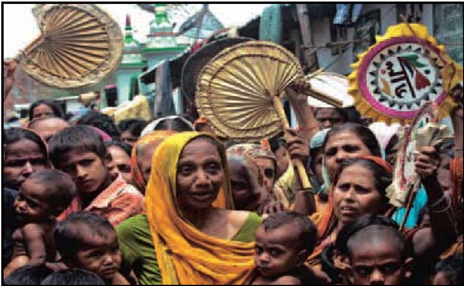
Apátridas biharis protestan en las calles de Dhaka, ciudad donde no se les ha concedido su ciudadanía desde la independencia de Bangladesh en 1971.