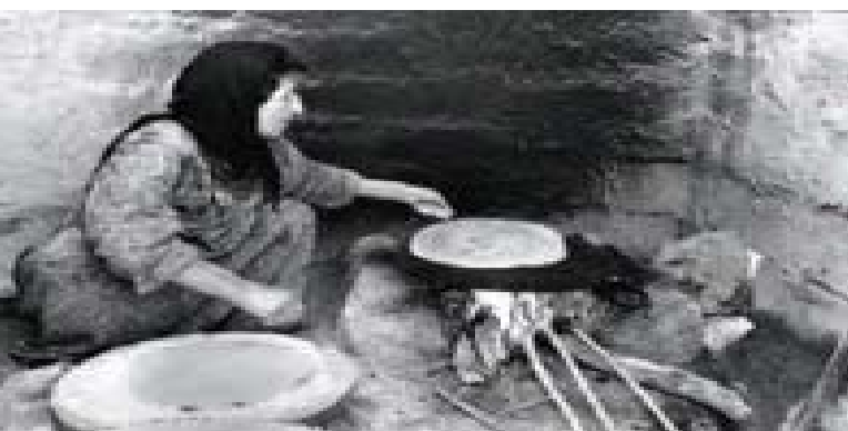
Muchos kurdos se convirtieron en apátridas como resultado de la guerra entre Irán e Iraq.

Un apátrida es alguien que, en virtud de la legislación nacional, no goza de la ciudadanía de ningún país, es decir, del vínculo jurídico que existe entre el Estado y el individuo. El artículo 1 de la Convención sobre el Estatuto de los Apátridas de 1954 establece la definición legal del apátrida señalando que se trata de toda persona que no sea considerada como nacional suyo por ningún Estado conforme a su legislación.