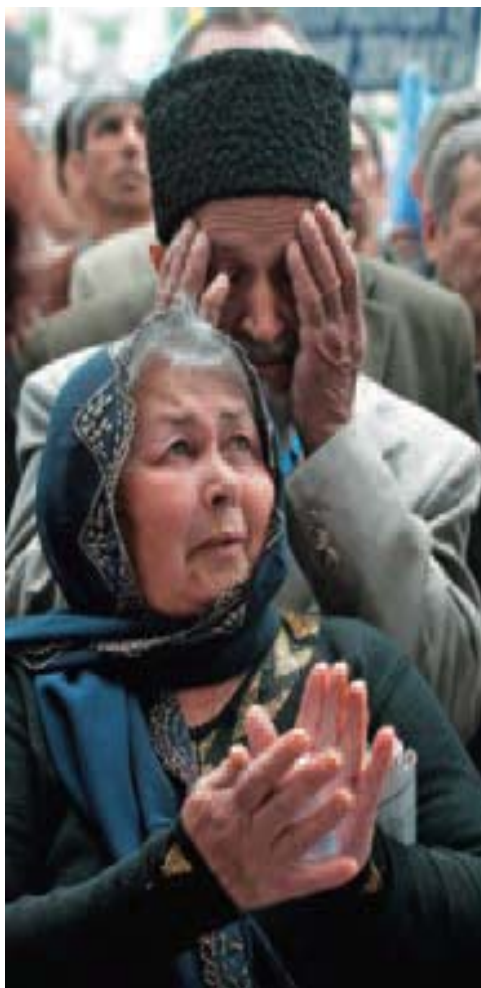
Tártaros de Crimea en Simferópol, Ucrania, durante la conmemoración del sexagésimo aniversario de su deportación masiva a Asia Central durante la Segunda Guerra Mundial.