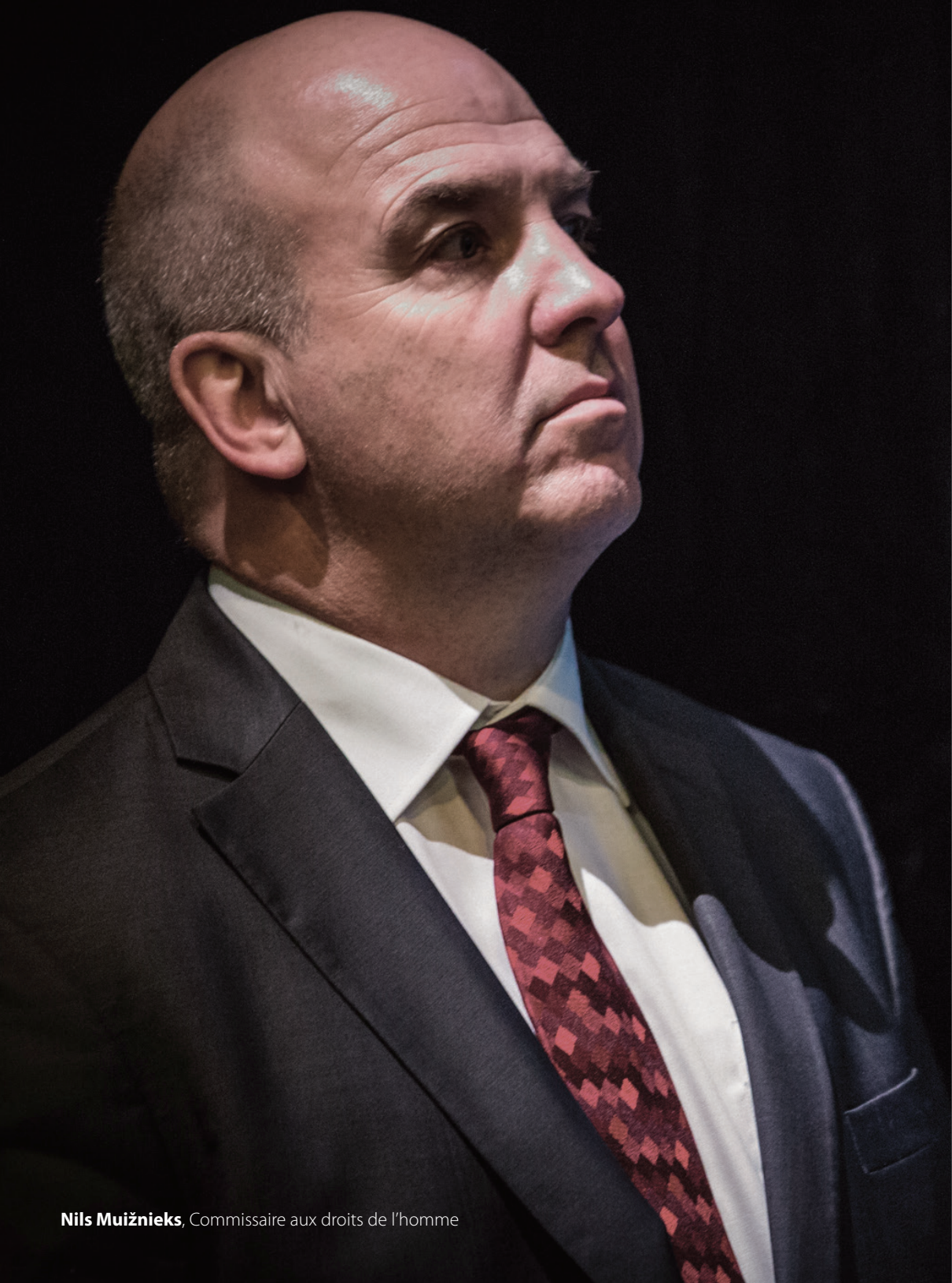
Nils Muižnieks , Commissaire aux droits de l'homme