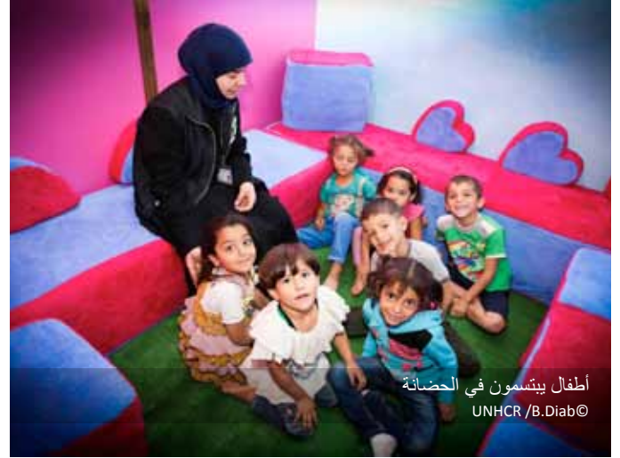
أطفال يبتسمون في الحضانة