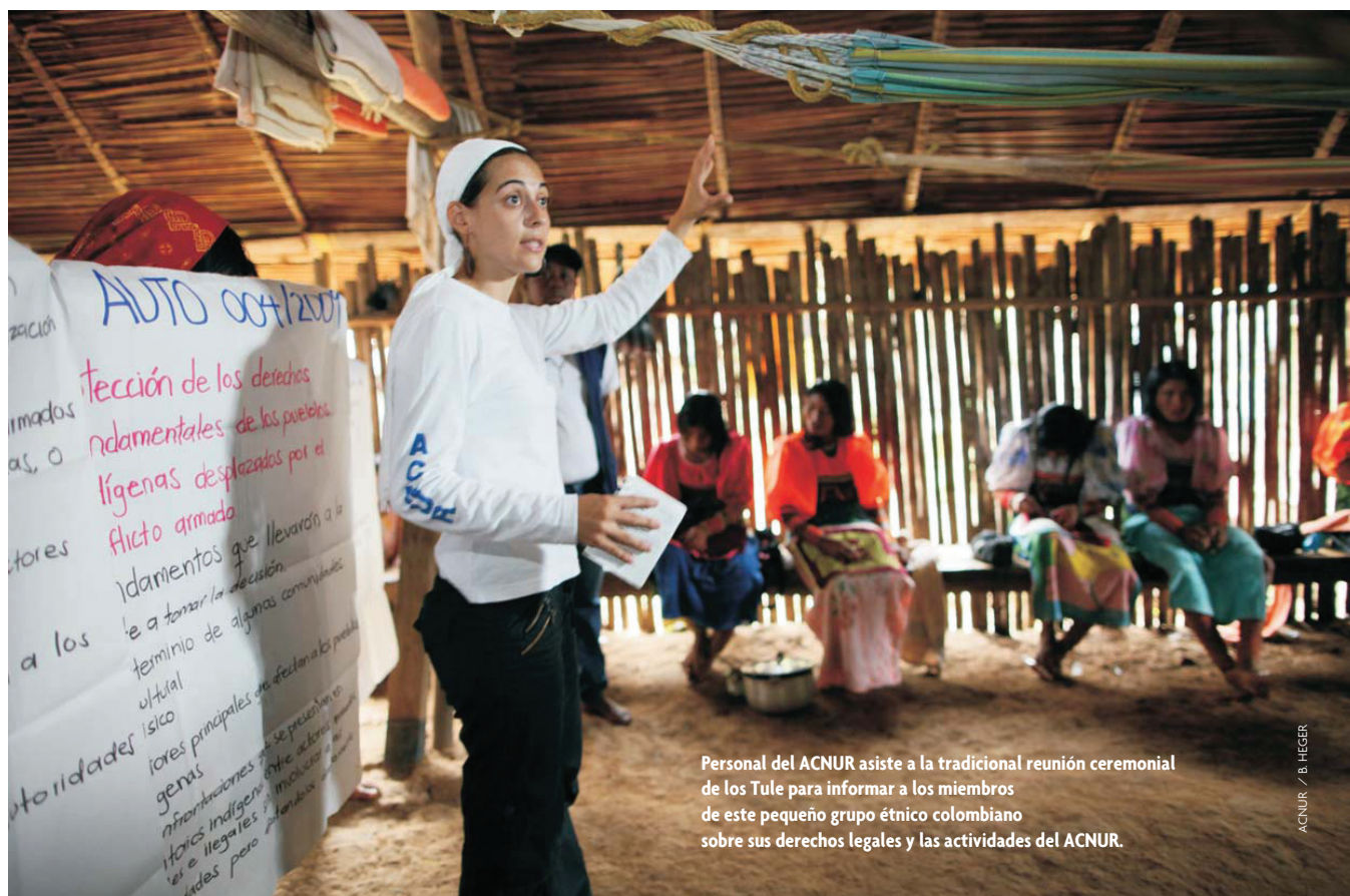
Personal del ACNUR asiste a la tradicional reunión ceremonial de los Tule para informar a los miembros de este pequeño grupo étnico colombiano sobre sus derechos legales y las actividades del ACNUR.